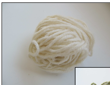
Laine avant teinture