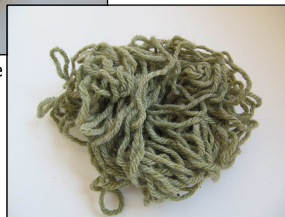
Laine après teinture au Nerprun purgatif