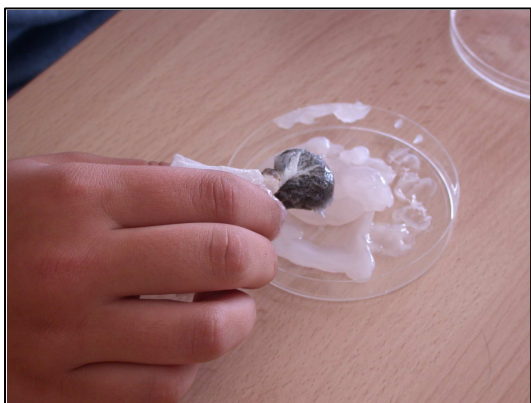
Réalisation de pommade de Consoude officinale