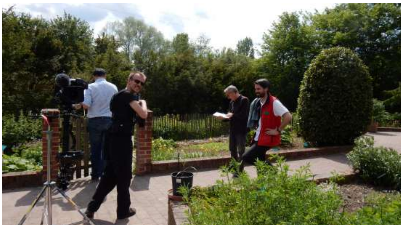
Tournage pour l'émission «Enquêtes de région» de France 3 Hauts-de-France - B. ASSET