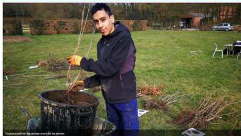
Tinglons profiter les autres avant de les planter