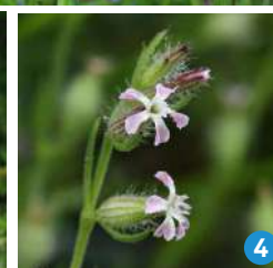
L'ail à tête ronde (1), le grémil bleu pourpre (2), la cynoglosse d'Allemagne (3) et le silène de France (4) sont quatre espèces en danger.

observe sur moins de 1 ha, sur les pelouses sableuses d'Ermenonville. « Les moutons permettaient de conserver cette plante. Ils ont été retirés », regrette le botaniste. De même pour la menthe pouliot, qui ne survit dans le nord du pays que grâce au pâturage des prairies humides dans le Compiègnais. « L'augmentation des sites gérés par le Conservatoire d'espaces naturels est une vraie bouffée d'oxygène », apprécie le CBNBL.