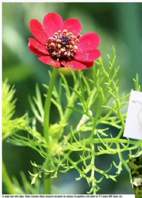
Le dianthus dans cette région. (Photo: Jean-Christophe Hugel) - Copie de la liste rouge de la flore menacée dans les Hauts-de-France.

Sur les 1300 espèces végétales indigènes des Hauts-de-France, une espèce sur dix a disparu depuis le début du XIXème siècle. 20 espèces sont considérées comme disparues, 122 espèces sont menacées, 122 espèces sont menacées, 122 espèces sont menacées. Au total, 22,4% des espèces sont menacées, soit presque le quart.