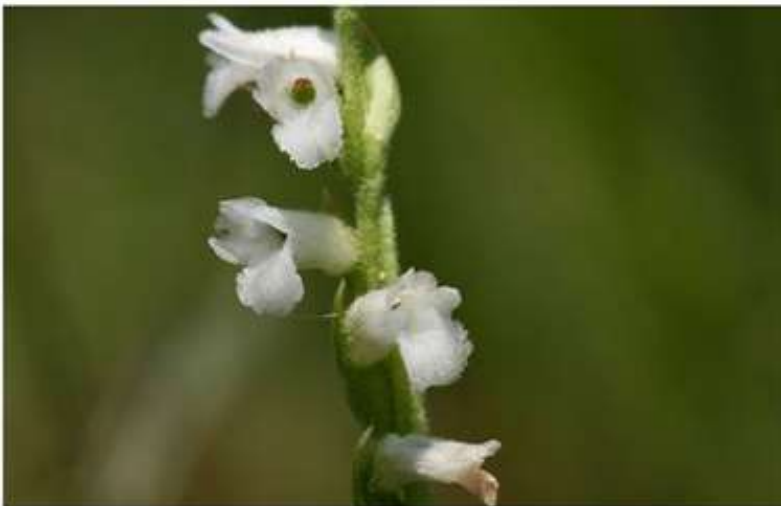
Le Spiranthes, une plante disparue en Hauts-de-France. - Conservatoire botanique de Baillieux

Vous pouvez vous balader n'importe où dans la région, même dans les endroits les plus reculés, jamais plus vous ne trouverez de Spiranthes . Cette plante, comme 131 autres espèces indigènes, a tout simplement disparu. Selon le Conservatoire, depuis les premiers recensements botaniques au début du XIX e siècle, près de 9 % des 1.500 espèces de plantes spécifiques à la région n'existent plus. « Le pire, c'est que le rythme de ces disparitions s'accélère. Aujourd'hui, ce sont 200 autres espèces qui sont directement menacées et inverser le processus semble compliqué », déplore Thibault Pauwels, chef du service éducation, formation et écocitoyenneté au conservatoire botanique.