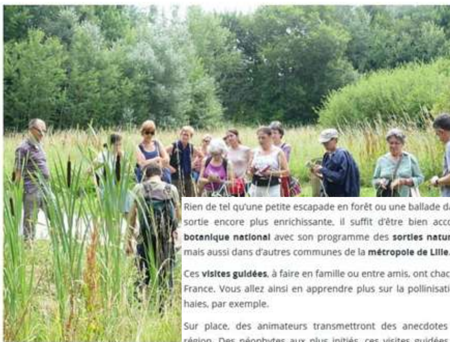
De nombreuses sorties nature

Rien de tel qu'une petite escapade en forêt ou une ballade dans un parc pour se ressourcer. Et pour rendre cette sortie encore plus enrichissante, il suffit d'être bien accompagné. C'est ce que propose le Conservatoire botanique national avec son programme des sorties nature qui se déroulent d'avril à juillet à Bailleul (Nord) mais aussi dans d'autres communes de la métropole de Lille .