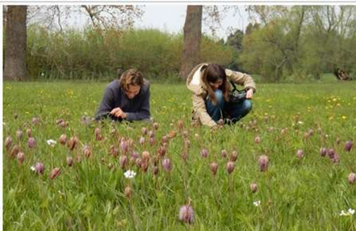
Le Conservatoire botanique de Bailleul a dressé une liste rouge des espèces menacées.