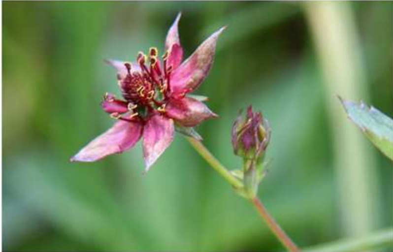
Le Comarum, espèce de tourbière, vulnérable en Hauts-de-France. - Conservatoire botanique de Baillieux