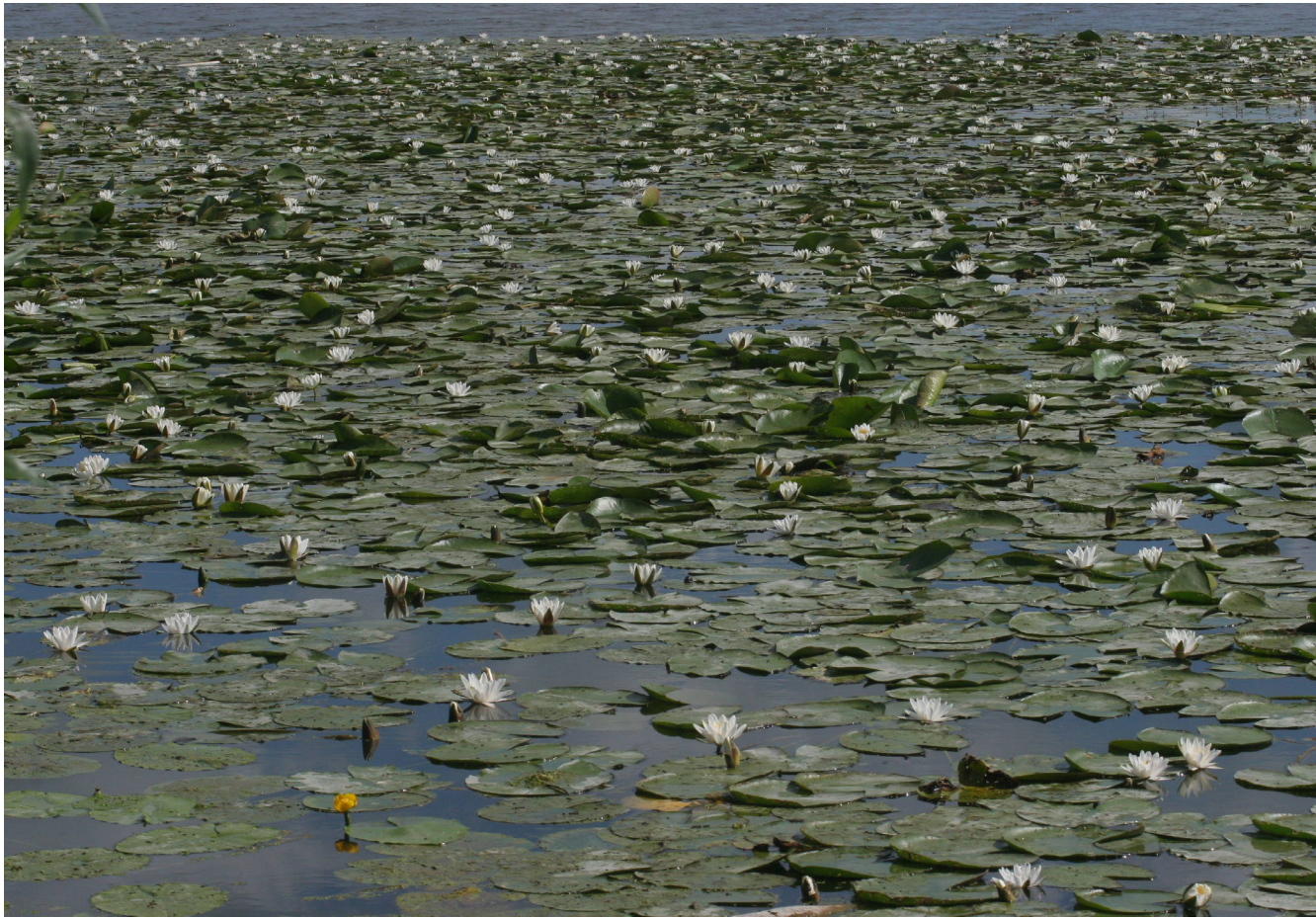
Contrairement aux apparences, le nénuphar blanc est sur la liste rouge mondiale des espèces menacées.

Si vous en observez au détour de vos balades, ne les cueillez pas. D'abord parce qu'elles ne résisteraient pas longtemps, contentez-vous de les admirer, de les photographier, voire de les dessiner comme le faisait Claude Monet. Surtout, faites-en